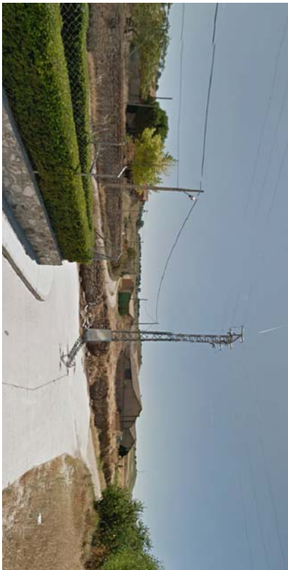
VILLAHÁN. PARCELA. IMAGEN 1