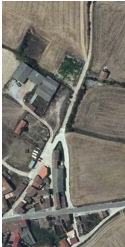
VILLAHÁN. ORTOFOTO AEREA DE PARCELA.