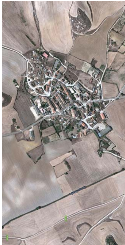
VILLAHÁN. ORTOFOTO AEREA