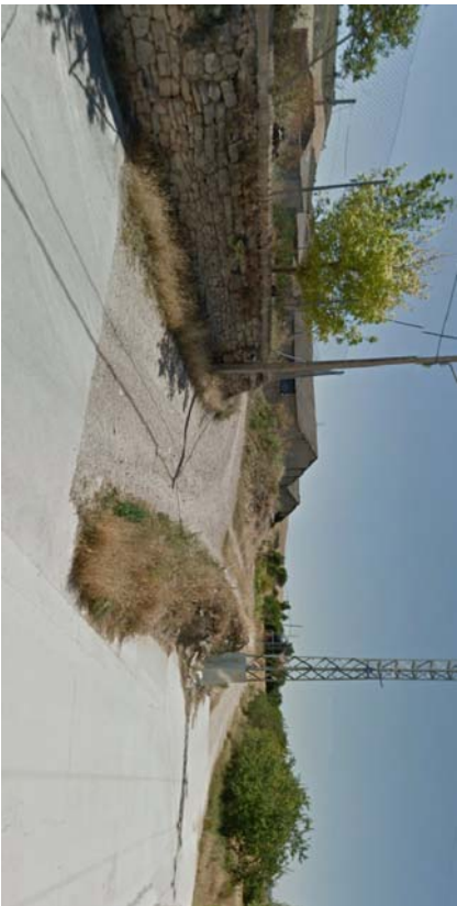
VILLAHÁN. PARCELA. IMAGEN 2.